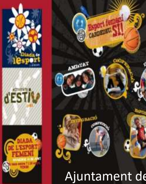
Ajuntament de Cardedeu